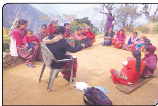
खलंगा, दार्चुला शाखाको उच्च पहाडी पद्धती (HMM 51) धौकोट डाँडाको केन्द्र बैठक