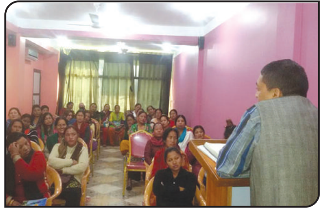
हेटौडा, मकवानपुर शाखाको केन्द्र प्रमुख अन्तरक्रिया गोष्ठीमा सहभागी हुँदै केन्द्र प्रमुखहरू