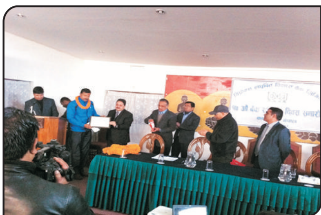
१७ औं बैंक स्थापनाको अवसरमा शाखा कार्यालयहरूलाई पुरस्कार वितरण गर्नुहुँदै बैंकका अध्यक्ष