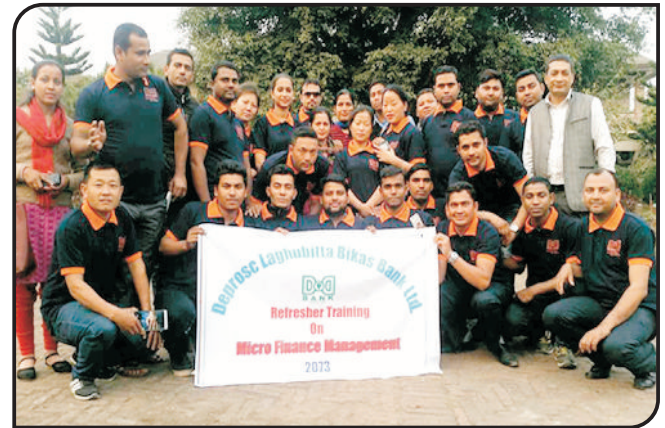
बैंकद्वारा आयोजित लघुवित्त व्यवस्थापन तालिममा सहभागी कर्मचारीहरू