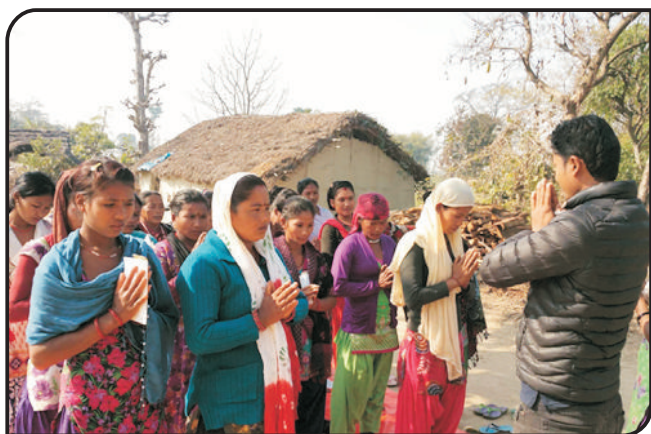
बीरपुर, कपिलबस्तु शाखाको केन्द्र नं. ३७ बनकट्टाको केन्द्र बैठक