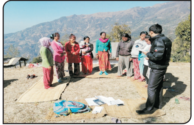
फुङ्गलिङ्ग बजार, ताप्लेजुङ्ग शाखाको उच्च पहाडी पद्धती (HHM 51) शिवालय चोकको केन्द्र बैठक