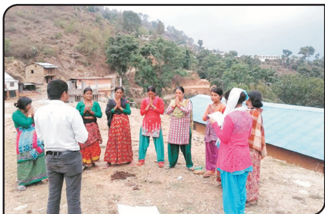
मंगलसेन, अछाम शाखाको उच्च पहाडी पद्धती (HMM 8) भाटबाँडा केन्द्र बैठक