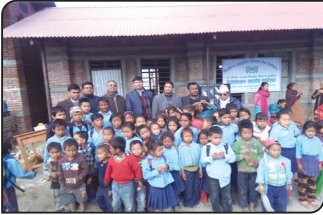
१७ औं बैंक स्थापनाको अवसरमा श्री कालिका निम्न मा.वि., बेलकोट-६, नुवाकोटलाई पुस्तकालय सहयोग कार्यक्रम